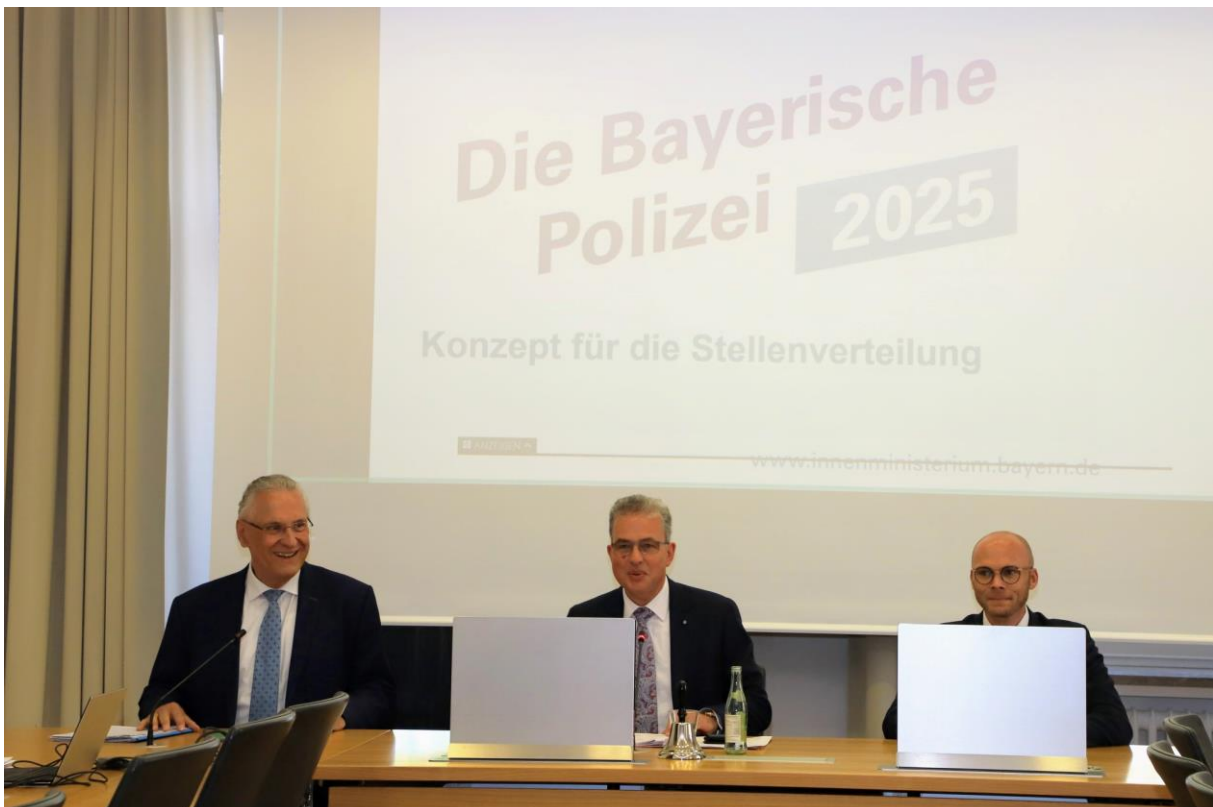
Staatsminister Herrmann zu Besuch in der Fraktionssitzung

Um Bayerns Wirtschaft schnell wieder hochfahren zu können, haben wir uns in einem Dringlichkeitsantrag dafür eingesetzt, die Unternehmensbesteuerung in Deutschland zu modernisieren . Denn sonst fallen wir im internationalen Steuerwettbewerb immer weiter zurück. Mit einem durchschnittlichen kombinierten Steuersatz von mehr als 30 Prozent für Kapitalgesellschaften weist die Bundesrepublik im Vergleich zu anderen EU-Staaten sowie einer Vielzahl von OECD-Ländern einen der höchsten Unternehmenssteuersätze auf. Daher ist es höchste Zeit für eine nachhaltige und umfassende Unternehmenssteuerreform. Zusätzlich wollen wir die Binnenkonjunktur auch durch eine schnelle und vollständige Abschaffung des Solidaritätszuschlags ankurbeln, denn in Krisenzeiten bedarf es einer allgemeinen und schnellen Entlastung aller Arbeitnehmer. Ferner sollten das Außensteuerrecht modernisiert und Verbesserungen bei Verlustrechnung und Abschreibungsbedingungen erzielt werden. „Je schneller Wirtschaftsgüter abgeschrieben werden können, desto niedriger ist die steuerliche Bemessungsgrundlage. Der damit einhergehende Liquiditätsvorteil kann dann für Investitionen genutzt werden.“